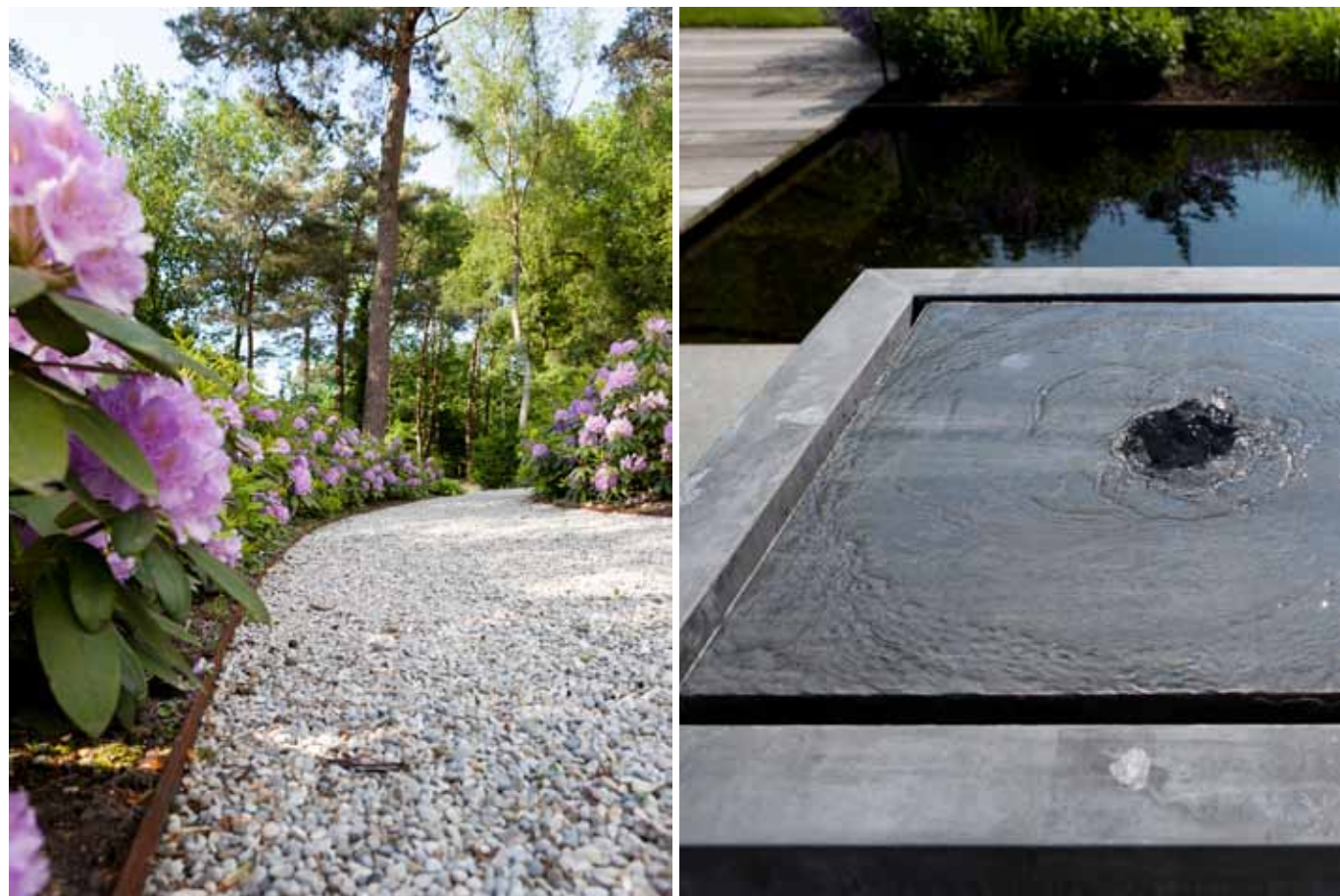
Links: niet alleen bloemen en planten zorgen voor afwisseling in de tuin. Ook over de decoratieve interpretatie van de looppaden werd nagedacht. De paden kregen het fraai geronde Perlé Noir als invulling. Rechts: in deze tuin is genieten het kernwoord. Genieten, zowel van ruimtelijkheid als van privacy en van de rust van het water. Dat laatste tot in het kleinste detail, zoals in de vorm van een fraaie zinken fontein van Domani.