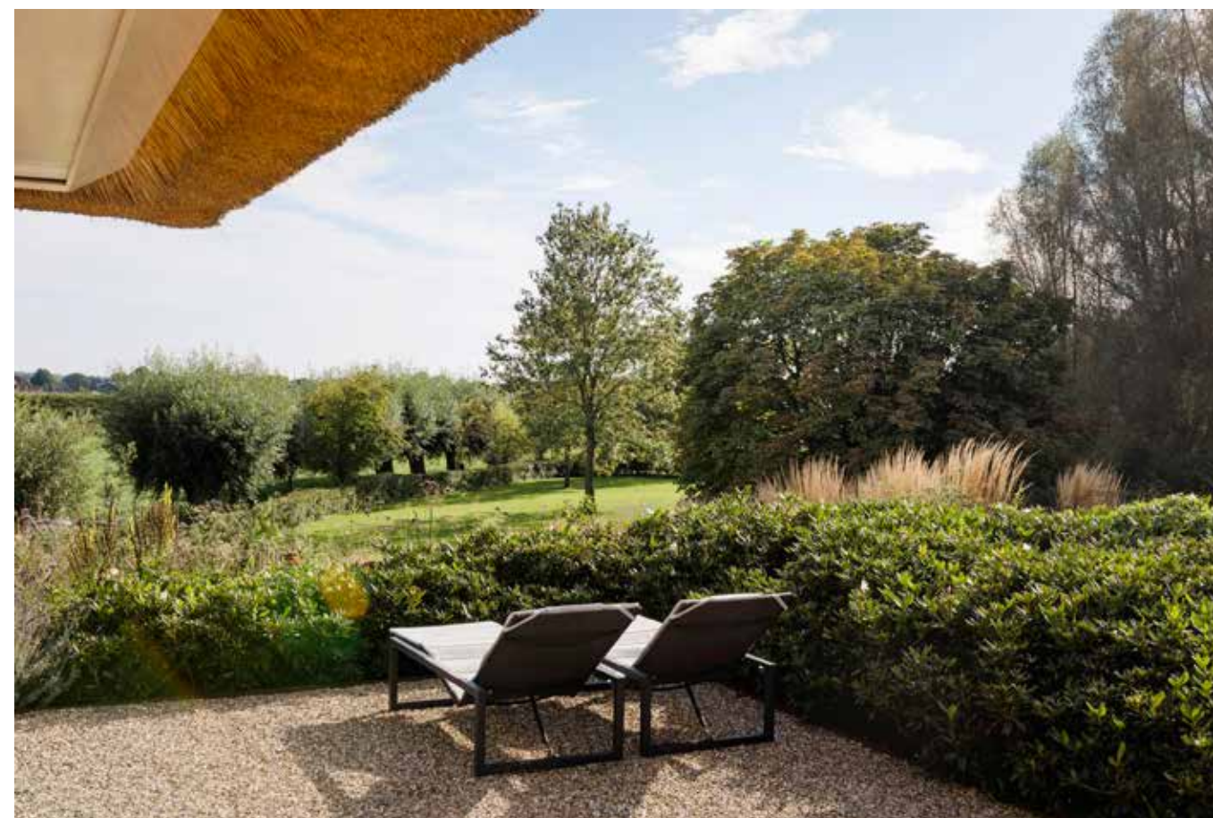
Vanaf het beschutte terras aan de voorzijde van het huis kijk je uit over het rivierenlandschap met z'n oude knotwilgen. Stoelen, tafels en ligbedden zijn van Royal Botania.

“Er is alle jaargetijden wel een fijn zon- of juist schaduwrijk plekje te vinden om te zitten”