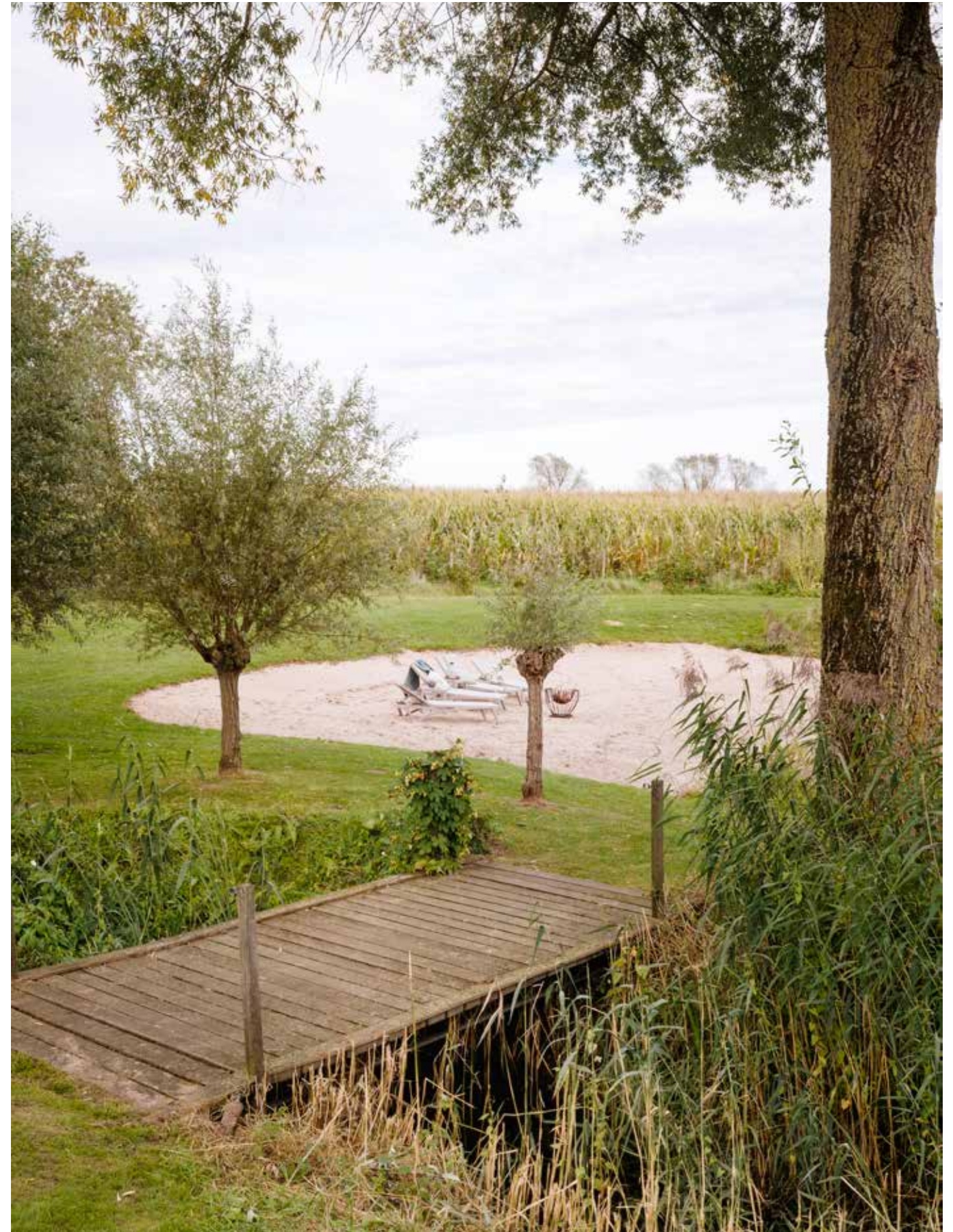
Het bruggetje verbindt de tuin met het strandje en de poel die erachter liggen. De Oude Rijn is hier ooit buiten zijn oevers getreden. Op die manier is de poel ooit ook ontstaan. Het water stond afgelopen winter zo hoog, dat het bruggetje onder water verdween.