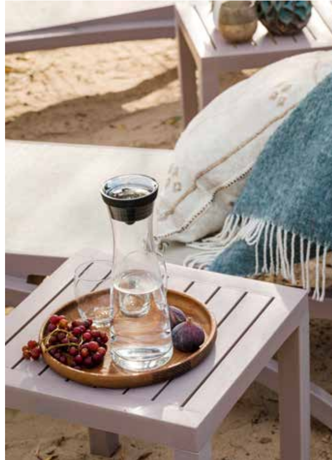
Het strandje bij de poel is een van de plekken waar het gezin graag zit. De ligbedden en het tafeltje zijn van Siesta.

“Er zijn hazen, fazanten en reeën komen drinken bij de poel”